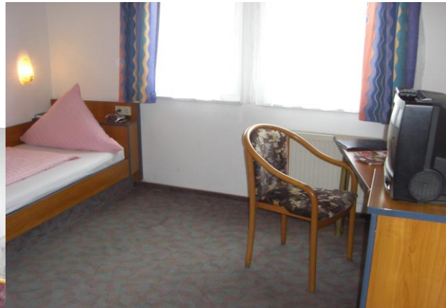
Standard und Komfortzimmer

In unserem Hotel finden Sie komfortabel ausgestattete Doppelzimmer, darunter zum Teil Familienzimmer, spezielle Zimmer für Allergiker, besonders ausgestattete Zimmer für Rollstuhlfahrer, romantische Kuschelzimmer für Verliebte und natürlich die Hochzeitssuite.