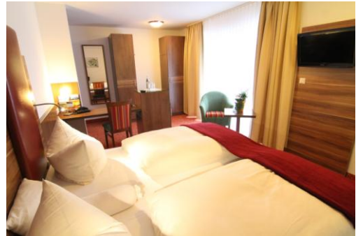
Superior und De Luxe Zimmer im Anbau von 2010