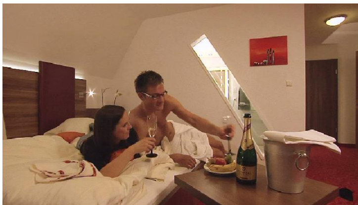
Romantikzimmer speziell geeignet für verliebte Paare.